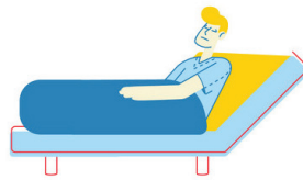
STAY HOME, WHEN SICK

گروه پزشکی اجتماعی دانشگاه علوم پزشکی شهید بهشتی «انجمن علمی پزشکی اجتماعی ایران» پایگاه خبری پیشگیری و سلامتی بالینی «سایبیا»